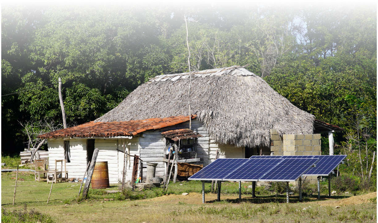
Instalación de los Sistemas Fotovoltaicos Autónomos (SFVA) en la comunidad Los Alazanes, municipio Sancti Spíritus - Sancti Spíritus.

La selección de las técnicas e instrumentos deben estar en coherencia con el objetivo que se persigue, las características de los sujetos y la distribución de roles asignados en cada una de las etapas del proyecto. En el caso que nos ocupa, el proceder metodológico planteado tiene como propósito fundamental favorecer la autoconstitución de sujetos para elevar el protagonismo popular para la toma de decisiones en favor de la transición energética local.