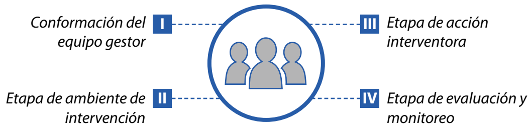
Fig. 2. Etapas de la metodología de intervención social.