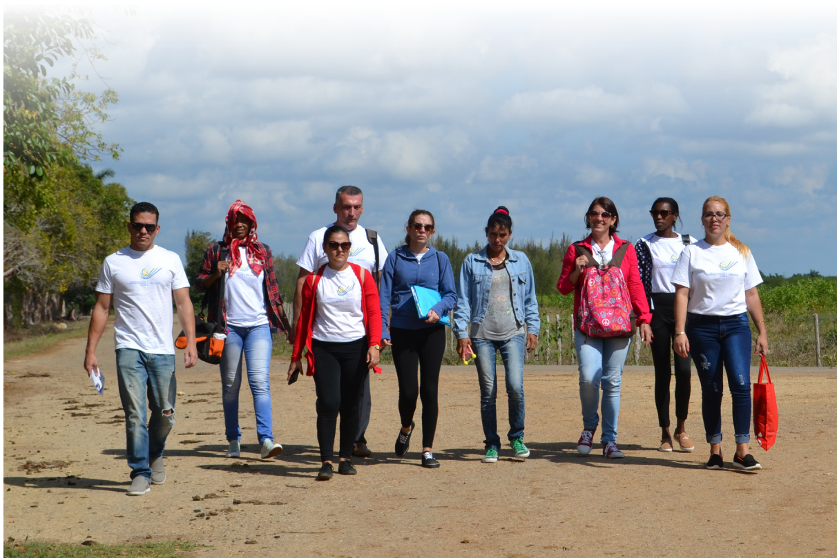
Evaluación integral a la comunidad Villena, municipio Calimete – Matanzas.

■ Respetar los tiempos pactados colectivamente, distribuir roles, velar por el cumplimiento de los objetivos propuestos y estimular la participación crítica de los sujetos hacen parte de los sentidos de los procesos formativos desde la Educación Popular.