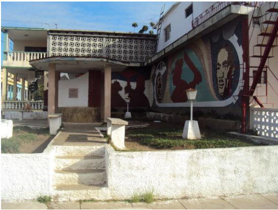
Parque Jesús Menéndez.