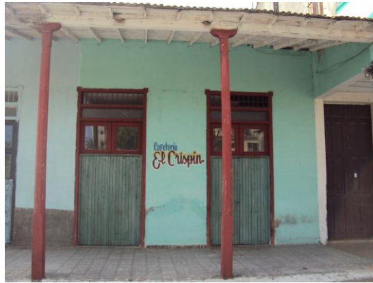
Antigua Cafetería El Crispín.