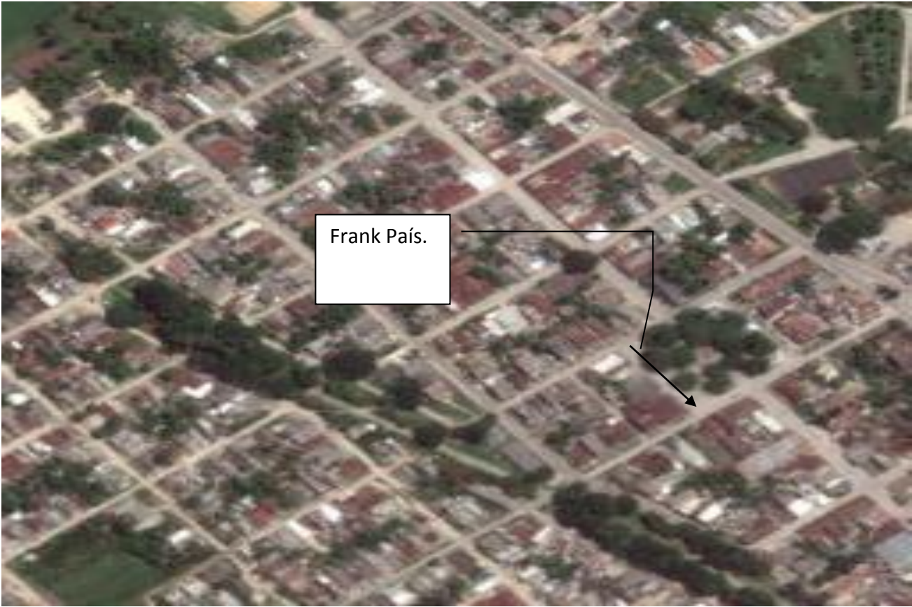
Foto satelital de la calle Frank País.