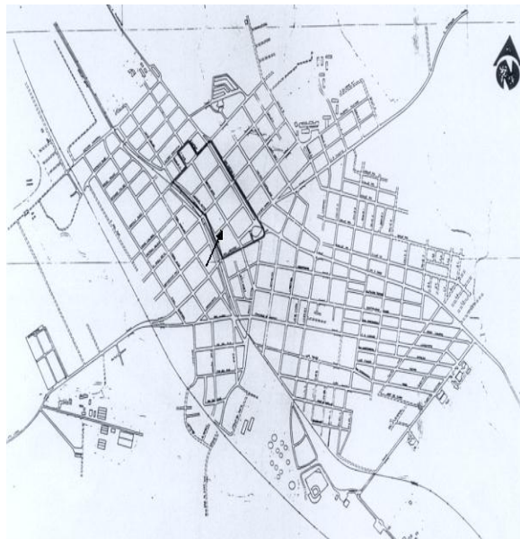
Figura 1.5: Ciudad de Cabaiguán actual.

El centro de la ciudad se considera que terminó su desarrollo en el año 1958, y desde esta fecha hasta la actualidad ha sufrido muy pocas variaciones. Este centro tradicional no ha sido declarado un centro histórico, pero en él se realizan un grupo de actividades comerciales, financieras, educativas, sociales, religiosas, administrativas, culturales y de producción que propician la concentración de la mayor parte de las funciones de la ciudad y por lo tanto el lugar más concurrido por sus habitantes. El centro, que coincide con la parte más vieja de la ciudad, es el área edificada entre la línea del Ferrocarril Central antiguo, la Carretera Central o Avenida Camilo Cienfuegos, la calle Manolo González con un desplazamiento alrededor del Parque José Martí y la Avenida de la Libertad (antiguo Camino de Cabaiguán a Santa Lucía).