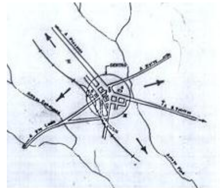
Figura 1.2: Etapa de 1901-1907.

El 7 de diciembre de 1926 el presidente de la República de Cuba actuante Mario García Menocal de la etapa de la República neocolonial, reconoce con los poderes judiciales y oficiales que le eran conferidos, la municipalidad de Cabaiguán, en toda esta etapa estuvo indisolublemente ligado el desarrollo del municipio con el de la ciudad.