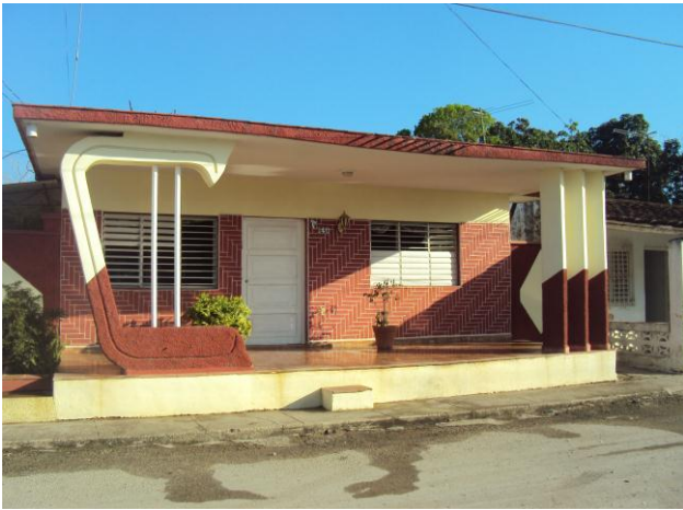
Foto de la calle