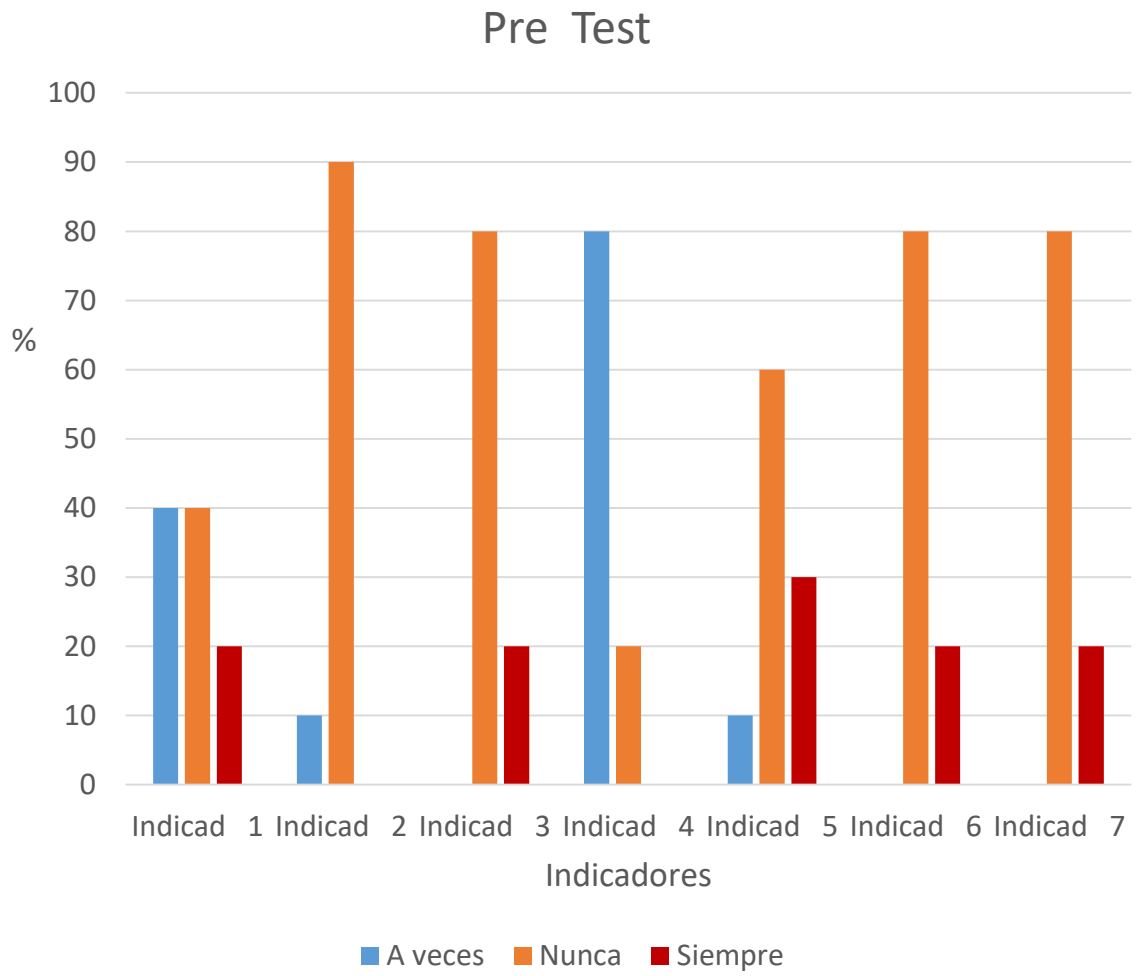
Gráfico 1: Resultados del Pre test