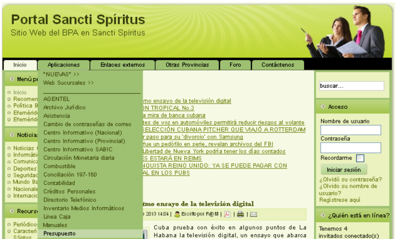
Ilustración 1 Portal Sancti Spiritus.