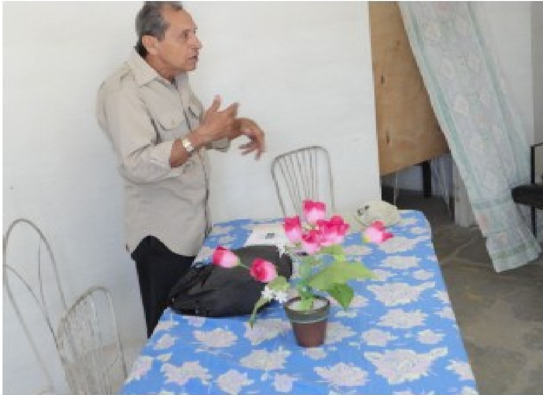
Coordinador de CABASUM