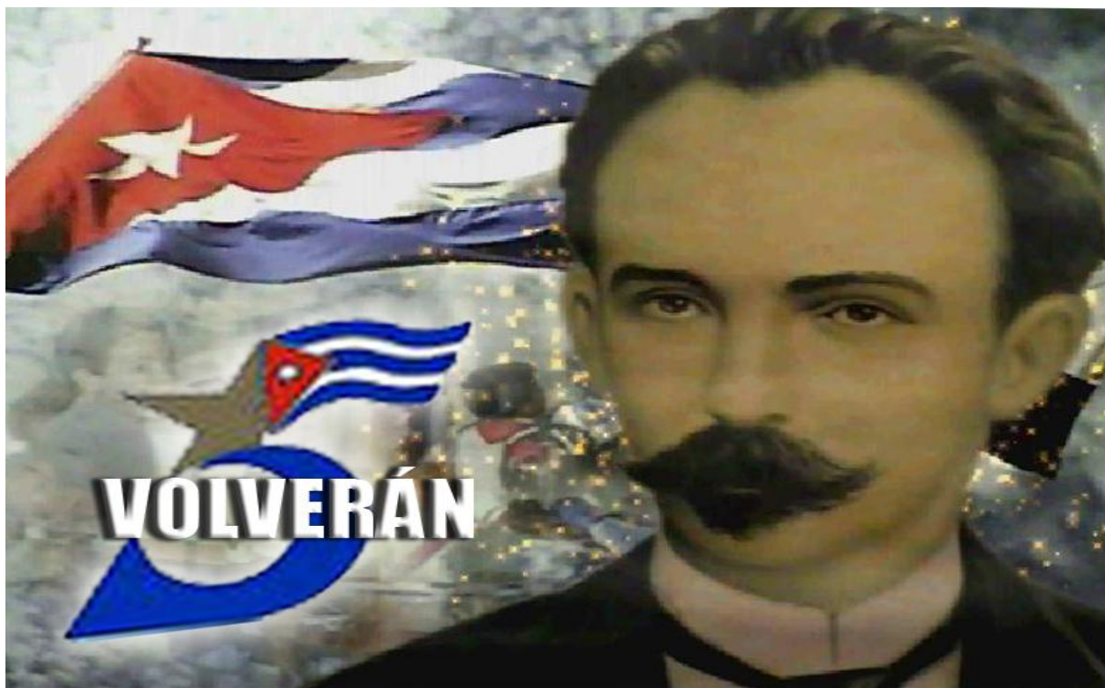
José Martí Pérez.

“El verdadero objeto de la enseñanza es preparar al hombre para que pueda vivir por sí decorosamente, sin perder la gracia y generosidad del espíritu y sin poner en peligro con su egoísmo o servidumbre la dignidad y fuerza de la patria”