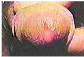
Uretrite por clamidia (no homem)