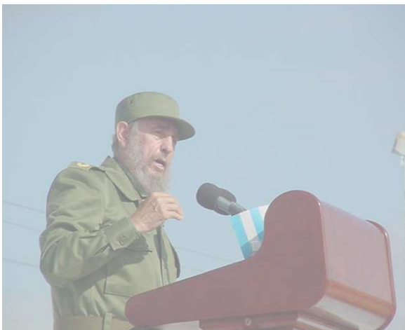
Fidel Castro Ruz

La educación no se inicia en las escuelas; se inicia en el instante en que la criatura nace, los primeros que deben ser esmeradamente educados son los propios padres (.....)