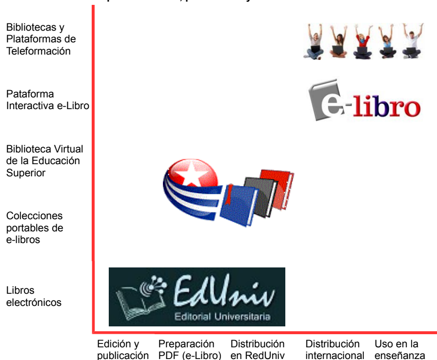
Tabla 1. Modelo para la edición, publicación y distribución e-libros académicos

En la Tabla 1 se presenta el modelo utilizado por la Editorial Universitaria para la edición, publicación y divulgación de e-libros.